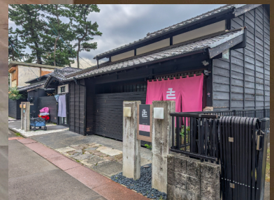
用宗は、リノベーションした一棟貸しの宿や様々な店舗が並び、建築を通じて街おこしをしています。 写真は複数ある一棟貸しの宿・日本色の内の一棟