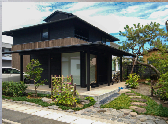
「用宗の家」外観見学 (設計・堀部安嗣建築設計事務所施工・マクス)